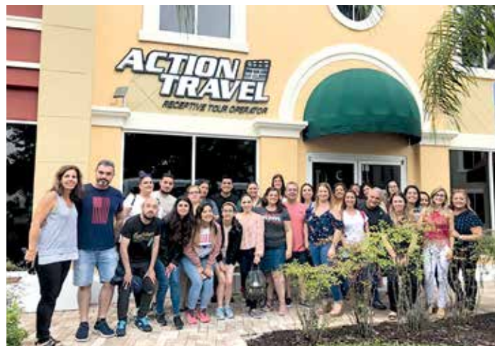
El grupo frente a la sede central de Action Travel.

Luego, en Universal Orlando Resort, se efectuaron site inspections a sus hoteles (Loews Sapphire Falls Resort, Endless Summer Resort - Surfside Inn & Suites, Cabana Bay Beach Resort y Aventura Hotel) y, claro está, tam-