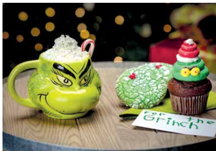
El Grinch, protagonista de la experiencia culinaria de UOR.

asado con hierbas, papas asadas, vegetales salteados y un crumble de manzana.