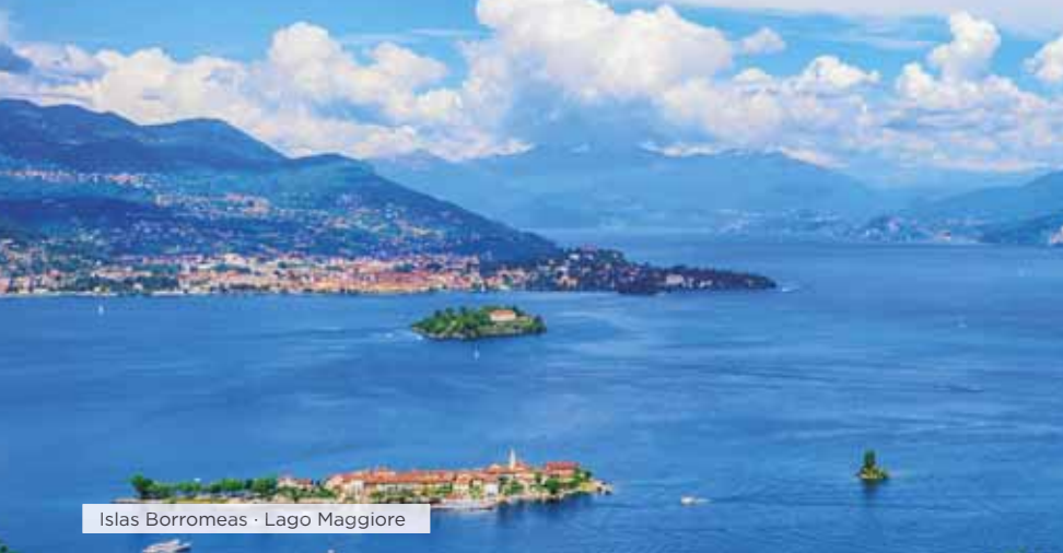
Islas Borromeas · Lago Maggiore