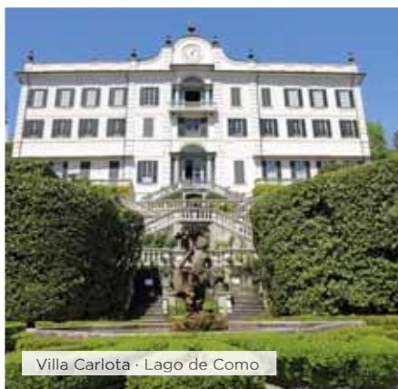
Villa Carlota · Lago de Como

Desayuno. Continuando por los Lagos Alpinos, nos dirigiremos a la ciudad suiza de Lugano, en el Lago del mismo nombre. Tendremos tiempo libre en el centro histórico de la ciudad y seguidamente subiremos en funicular al Monte Salvatore, desde donde realizaremos el almuerzo , además de disfrutar de excelentes vistas del Lago y del maravilloso entorno. Continuación a Locarno, que gracias a su situación geográfica excepcional a orillas del Lago Maggiore y al peculiar microclima subtropical de esta zona del cantón suizo Ítalo - parlante de Ticino se ha convertido en un destino turístico; donde se pueden practicar deportes al aire libre, admirar edificios llenos de historia y disfrutar de un animado ambiente. Tiempo libre para pasear por esta ciudad, punto de encuentro de figuras de renombre internacional y donde podrá pasear por el paseo de la fama, donde figuras como Santana, Sting o Juanes, tienen su propia estrella. Regreso a nuestro hotel en el Lago Maggiore. Cena y alojamiento.