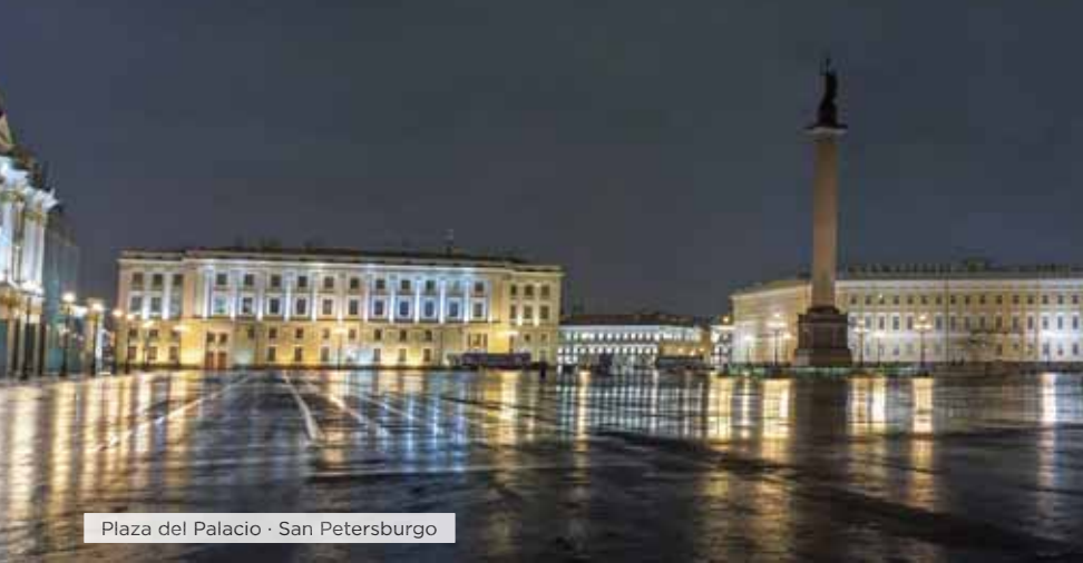
Plaza del Palacio · San Petersburgo