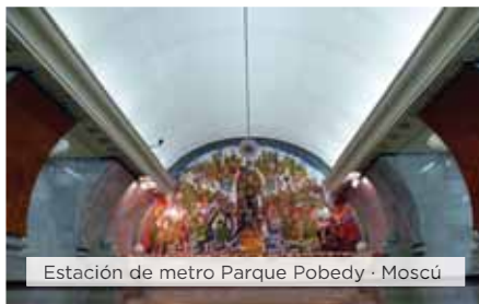
Estación de metro Parque Pobedy · Moscú

Desayuno. Llegada a San Petersburgo, capital cultural de Rusia, fundada por el zar Pedro el Grande en el año 1703 con el propósito de dar una salida a Rusia hacia Europa, siendo capital del país hasta 1918. La ciudad cambió de nombre varias veces, llamándose Petrogrado entre 1914 y 1924 y Leningrado, desde esa fecha hasta 1991 en que retomó