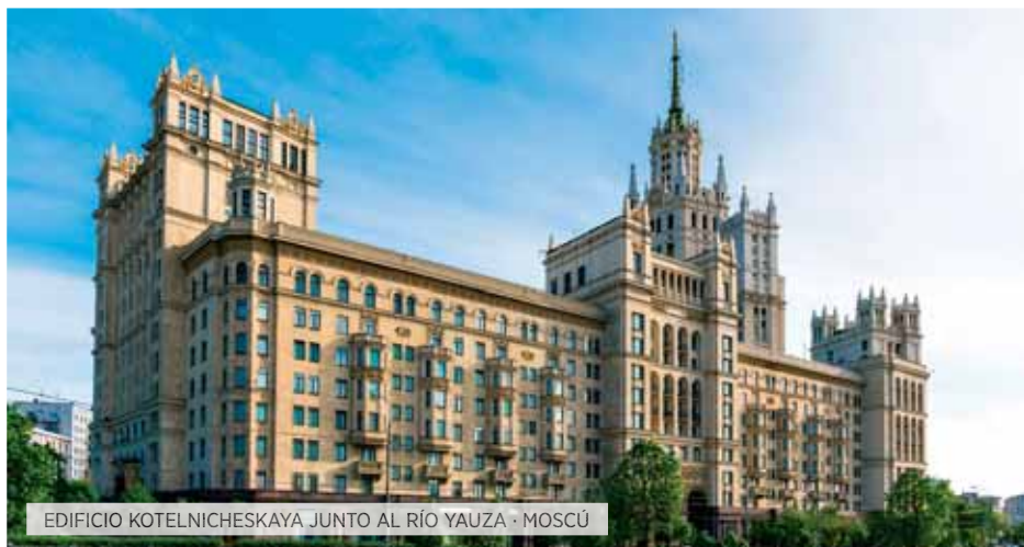
EDIFICIO KOTELNICHESKAYA JUNTO AL RÍO YAUZA · MOSCÚ