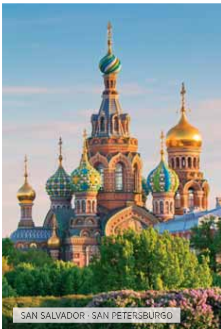
SAN SALVADOR · SAN PETERSBURGO

Desayuno. Día libre. Excursión opcional al Palacio de Pushkin o Yusupov. (Almuerzo Opción TI). Visita (Opción TI) de la Fortaleza de Pedro y Pablo, antigua prisión zarista, en la que hay una de las catedrales de la ciudad, la cual alberga las tumbas de la Dinastía Romanov, y la Catedral de San Isaac y su museo de iconos y mosaicos. Paseo opcional por los canales, conociendo sus rincones más