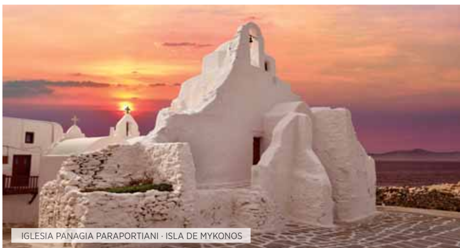
IGLESIA PANAGIA PARAPORTIANI · ISLA DE MYKONOS