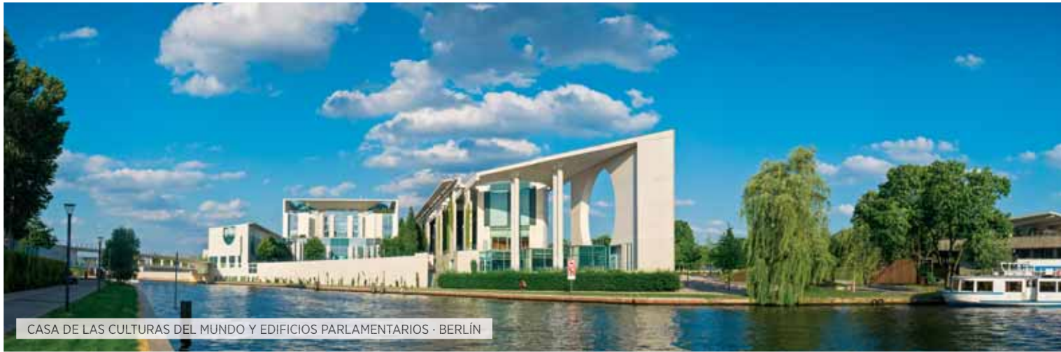
CASA DE LAS CULTURAS DEL MUNDO Y EDIFICIOS PARLAMENTARIOS · BERLÍN