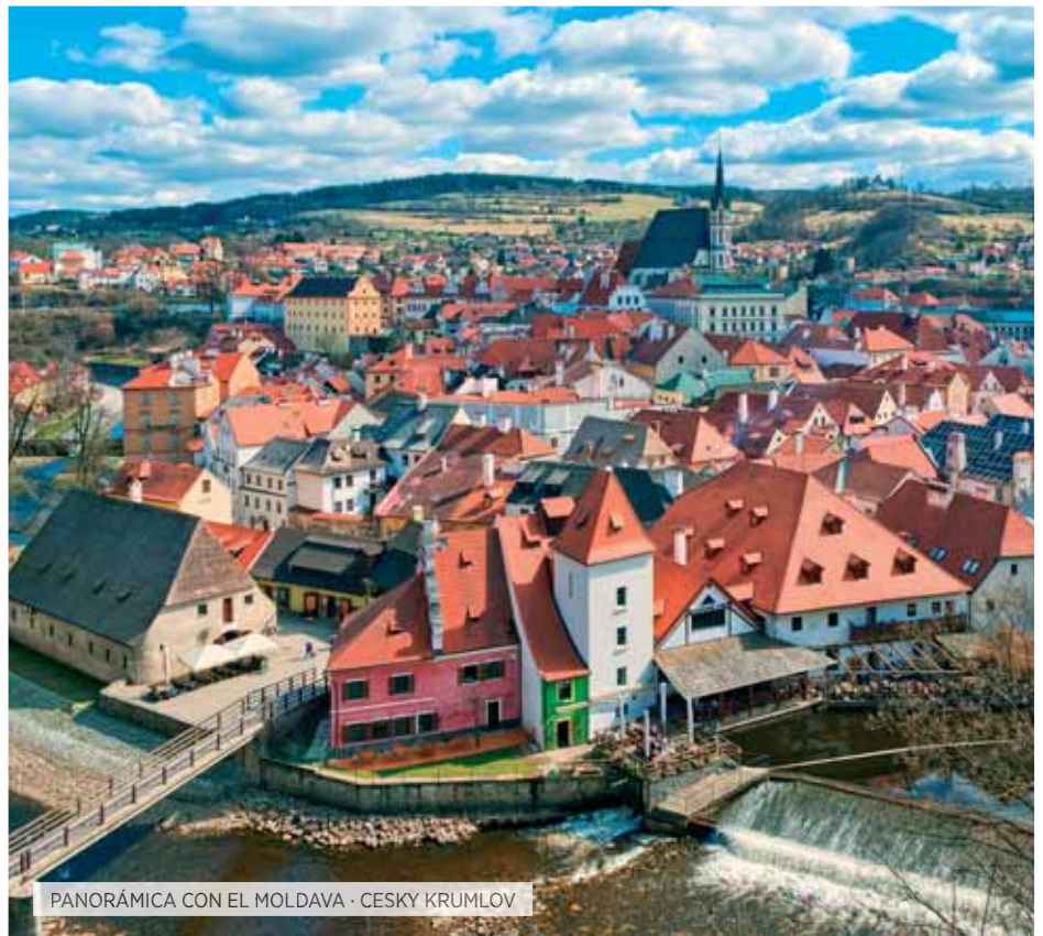
PANORÁMICA CON EL MOLDAVA · CESHY KRUMLOV

Desayuno. Día libre para conocer algunos de los numerosos museos de la ciudad en los que puede encontrar desde maravillosas colecciones de arte de las más antiguas civilizaciones hasta las últimas tendencias artísticas o disfrutar de las incontables opciones de compras que ofrecen las tiendas y grandes almacenes de la elegante avenida Kurfürsterdamm, entre otros lugares. o si lo desea podrá realizar una excursión opcional en la que podrá conocer de cerca la historia del siglo XX, profundizando en el Berlín Nazi del III Reich; conociendo los lugares más importantes que marcaron esa época: el andén 17, el lugar donde se encontraba el bunker de Adolfo Hitler, la Plaza de Baviera, los restos de la Gestapo, etc. y/o visitar el campo de concentración de Sachsenhausen, construido por las autoridades nazis en 1936 y en el que murieron durante esa época más de 30.000 prisioneros, posteriormente,